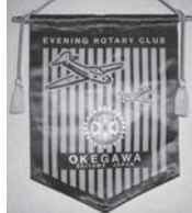
桶川イブニング ロータリークラブ 令和2年1月31日