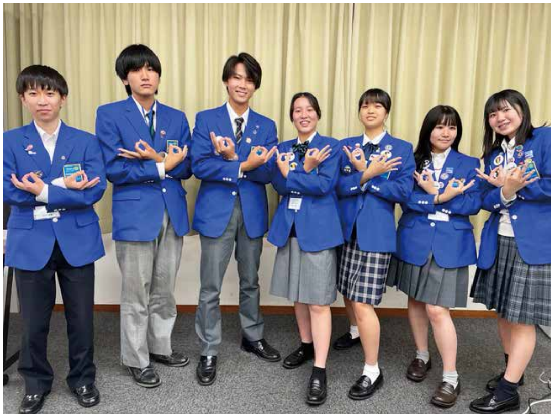
2023-24 年度 青少年交換留学生 7名