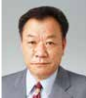
株式会社永生地所 (八潮イブニング) 令和5年7月28日