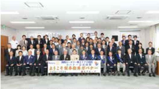
越谷ロータリークラブ第2993回例会 令和5年7月25日 越谷産業会館