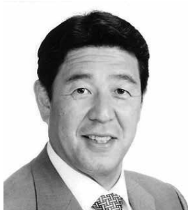
職業奉仕部門委員長