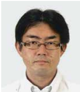
青少年交換委員長