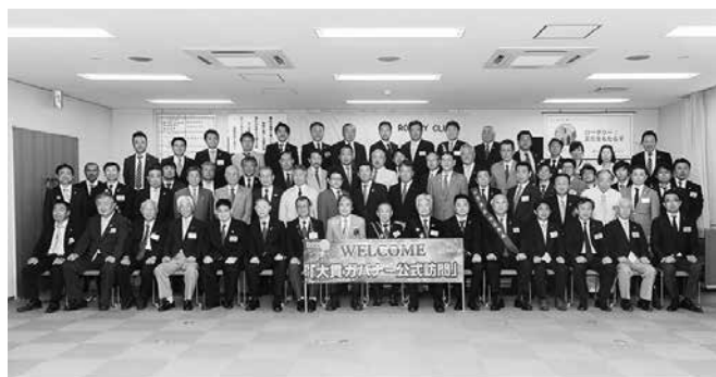
越谷ロータリークラブ第2743回例会 平成29年7月25日 越谷産業会館