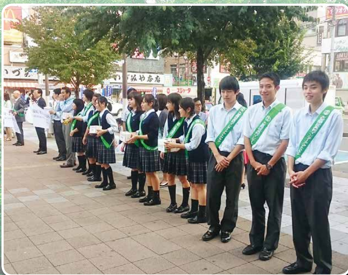
東北台風災害支援募金活動 (第3グループ大宮南 RC)