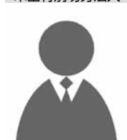
八潮環境事業協同組合