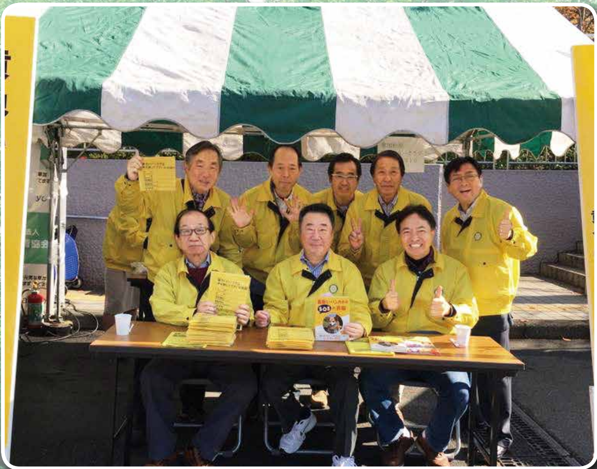
黄色いハンカチ運動 (第9G 草加松原 RC)