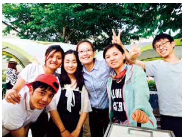
青少年フェスター (2017.6)