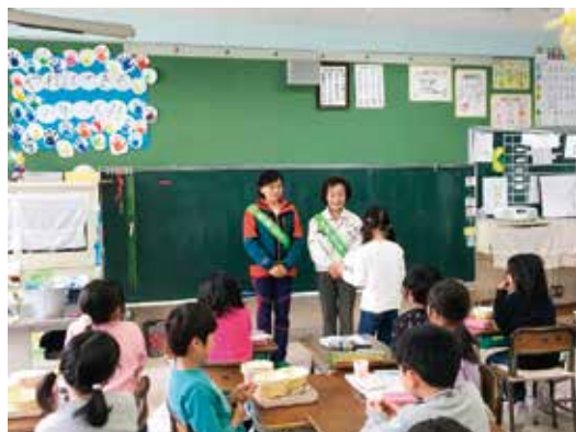
川口市立根岸小学校農園体験 (2017.3)