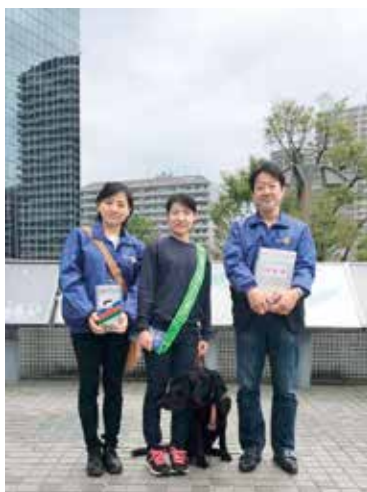
アイメイト街頭募金 (2017.4)

ロータリー、ロータリー米山記念奨学会、川口モーニングクラブ、皆は私の日本での生活を鮮やかにして頂いています。今の私には、皆様へ感謝しかありません。誠にありがとうございます。